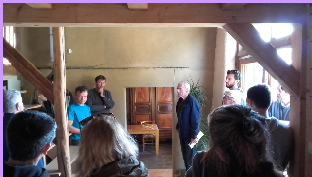
Les visiteurs attentifs aux explications sur le chauffage