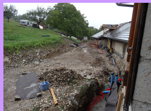
Un gros chantier réalisé par le collectif avant toute installation