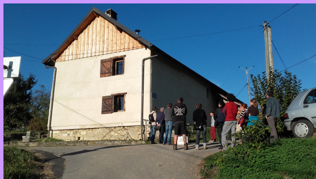
Un bâtiment qui s'intègre dans le paysage

selon la saison, ce sont soit un poêle à bois, soit une dalle chauffante alimentée par des panneaux solaires qui tempèrent la maison. Grâce aux matériaux isolants utilisés pour les murs, le solaire suffit en intersaison, et le chauffage d'hiver ne nécessite que 2 stères de bois pour 100 m 2 !