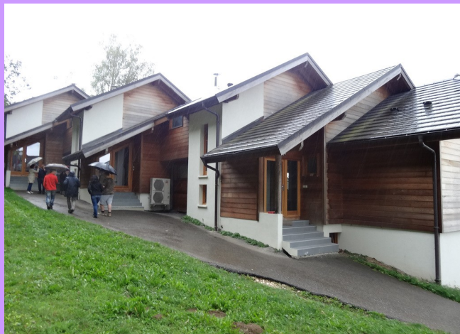
Les accès sur l'arrière des logements