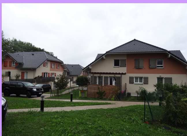
Les « grosses maisons » d'European Homes

Ce second exemple a permis d'observer un cas de densification de plus grande ampleur : 8 bâtiments collectifs d'environ 4 logements chacun, à Méry, commune péri-urbaine du bassin aixois. Ici, c'est d'abord l'architecture des bâtiments qui nous a intéressée : ces bâtiments apparaissent comme de « grosses maisons » relativement bien proportionnées et esthétiques. Les logements offrent des caractéristiques plus variées qu'à Épersy, tant du point de vue de leur exposition que de l'accès ou non à une terrasse en balcon ou de plain-pied. Il semble que la majorité des logements bénéficient d'un extérieur privatif, sans vis-à-vis. Les garages sont intégrés en sous-sol de chaque bâtiment.