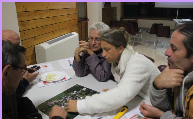
Où et comment positionner de nouveaux logements ?

À travers cet exercice, assez simple dans son principe, les apprentis-urbanistes ont pu appréhender de façon très concrètes les problématiques liées notamment à la proximité des bâtiments, leur forme ou encore leur orientation.