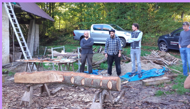
Façonnage d'une poutre en chêne sur site