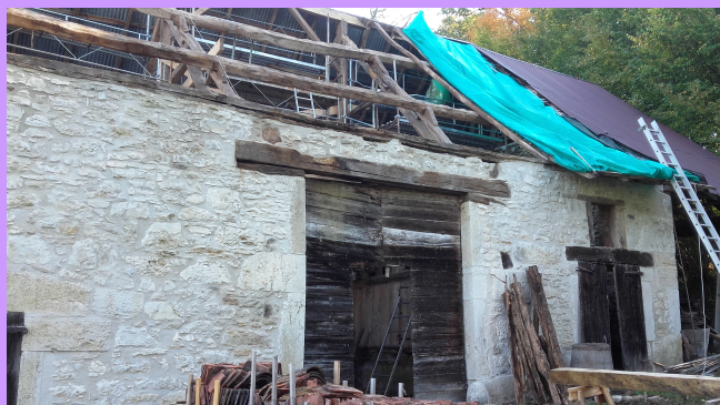
Après les murs, la charpente

Au-delà de la qualité du travail effectué (garanti à vie), c'est au service de la préservation du patrimoine matériel et immatériel que ces artisans s'engagent. Car, si le bâtiment bénéficie d'une nouvelle jeunesse, ce sont aussi les gestes et les techniques qui sont préservés et transmis.