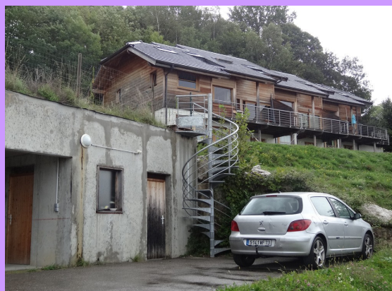
Le bloc garage en contrebas de la bande d'habitation

partement à l'étage de celui-ci. L'architecture laisse beaucoup de place au bois et aux ouvertures. Le garage est collectif et situé en contrebas des habitations, un chemin d'accès goudronné en pente forte permettant de rejoindre les habitations à pied ou en véhicule au besoin. Si certains choix ne semblent pas forcément fonctionnels en toute saison (notamment l'accès goudronné aux habitations, très pentu), cet exemple apparaît comme réussi du point de vue de l'intégration paysagère. Les habitants rencontrés ont en outre témoigné de logements agréables à vivre.