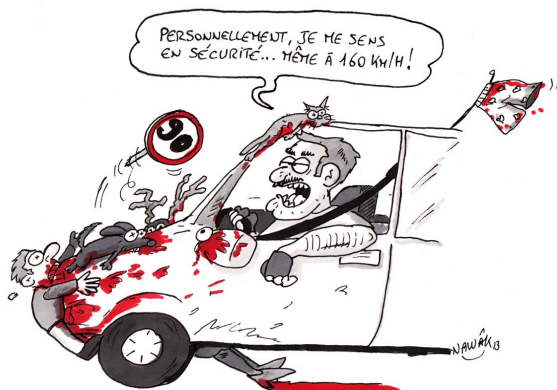
LA LIMITATION DE LA VITESSE AU VOLANT FAIT DÉBAT !

Cette attitude dangereuse est le fait de seulement quelques conducteurs (qui ne font peut-être que traverser la commune) mais, alors que la rentrée des classes a eu lieu, cela présente un risque non négligeable pour les enfants de l'école et les riverains en général.