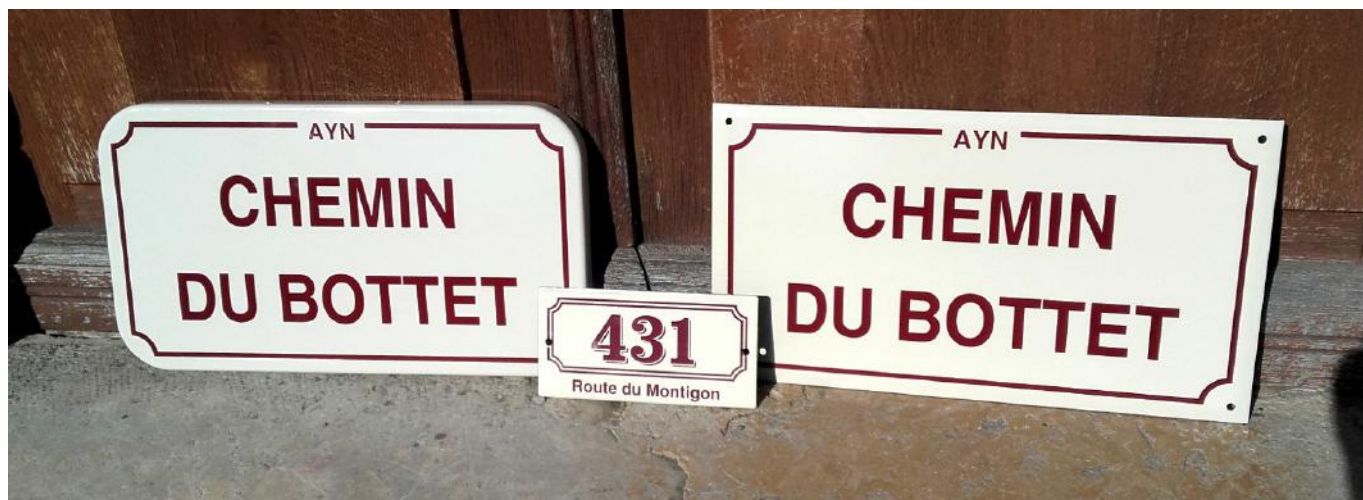
Plaque pour pose sur poteau

Vous pouvez les découvrir en avant-première en mairie où quelques exemplaires sont présentés.