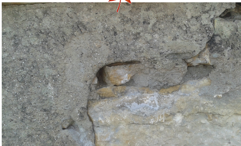
L'enduit ciment d'une précédente restauration