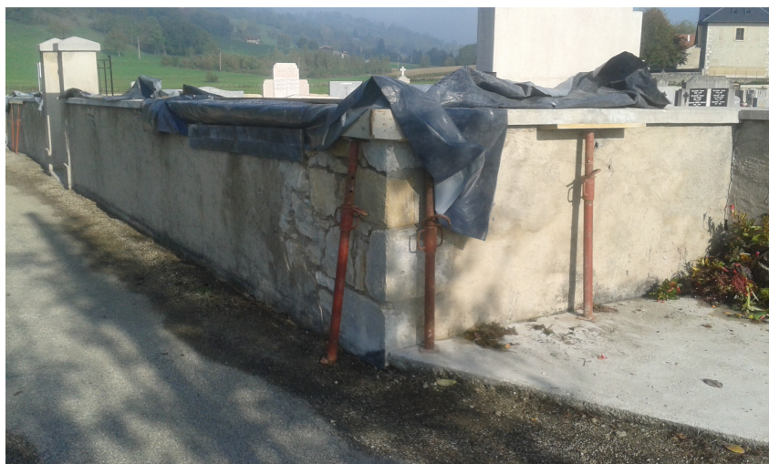
Chaînage d'angle, reprise des couvertines en cours