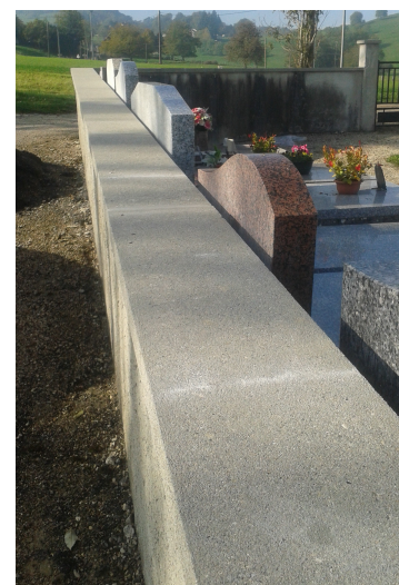
Les couvertines du nouveau cimetière restaurées